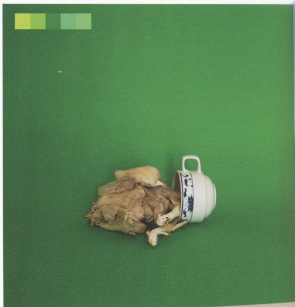
The Colour Chart Project - India Green