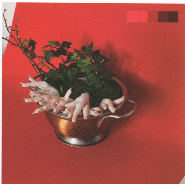
The Colour Chart Project - Imperial Red