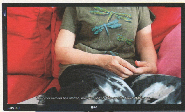
새우등 터지기 The back of the shrimp that cries , 싱글 채널 비디오, 5분 26초